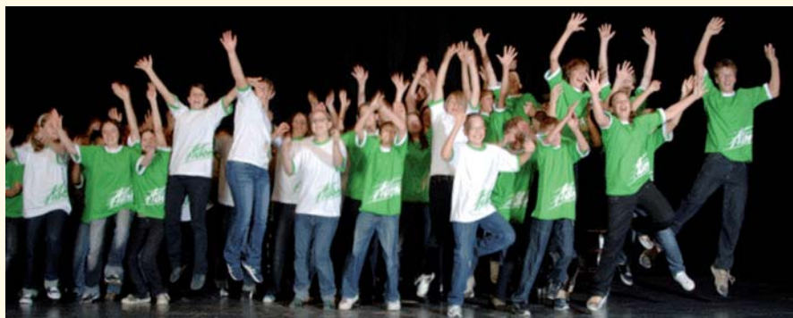
Ein Konzert für Junge und Junggebliebene.